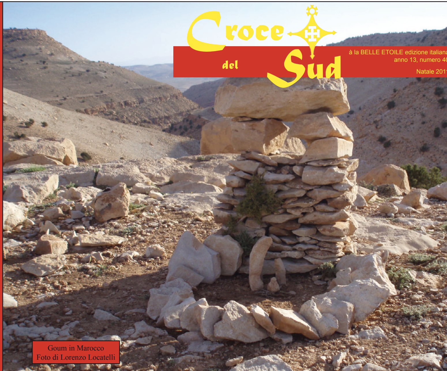
Goum in Marocco